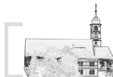
Pfarrei St. Johannes Dürmentingen

Wir laden Sie alle zum Novenengebet ein. Die Gebetshefte werden in unseren Kirchen zur Mitnahme ausgelegt. In den Tagen bis Pfingsten bietet Ihnen das Gebetsheft eine gute Vorlage um alleine oder mit anderen gemeinsam daheim zu beten.