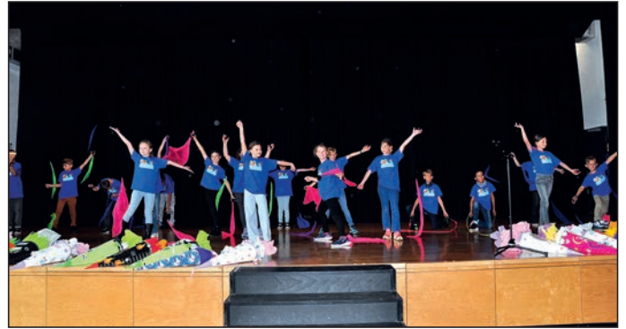
Auftritt der Klasse 4 bei der Einschulungsfeier