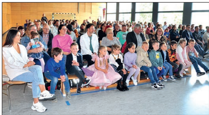
Vielen Gäste sind zur Einschulungsfeier gekommen