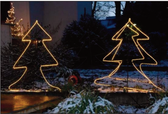
Weihnachtlicher Schlosszauber in St. Fidelis Heudorf am Freitag, 29.11.2024 von 16-21 Uhr statt